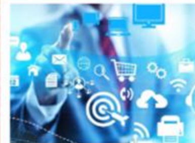
Simplificación de Trámites

Es la respuesta país para responder al reto de manejo eficiente, efectivo y transparente de la compra pública.